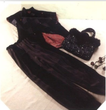
古布を使ったベストとパンツ 毛皮付バッグ 近藤ゆう子